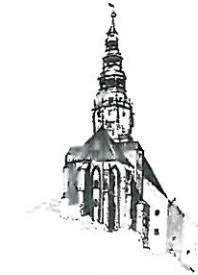
Kościół pw. Św. Stanisława i Św. Wacława Katedra Diecezji Świdnickiej

Stosownie do przepisów art. 270 ust. 1 ustawy z dnia 27 sierpnia 2009 r. o finansach publicznych (t.j. Dz. U. z 2017 r. poz. 2077) w załączeniu przekazuję sprawozdanie finansowe Miasta Świdnicy za 2017 r.